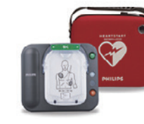
プライムメゾン横濱日本大通ほか